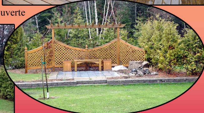
Au fond du terrain un espace foyer est aménagé avec fontaine d'eau et patio. On retrouve aussi un accès direct pour des véhicules

Pour VENDRE ou ACHETER avec VisibiliT — Une exclusivité Proprio Direct —