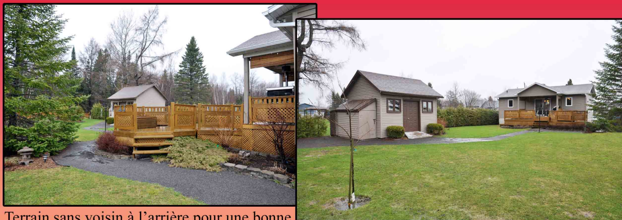
Terrain sans voisin à l'arrière pour une bonne intimité et aménagé avec gazon, arbres matures, plates-bandes de fleurs, haie de cèdres et remise