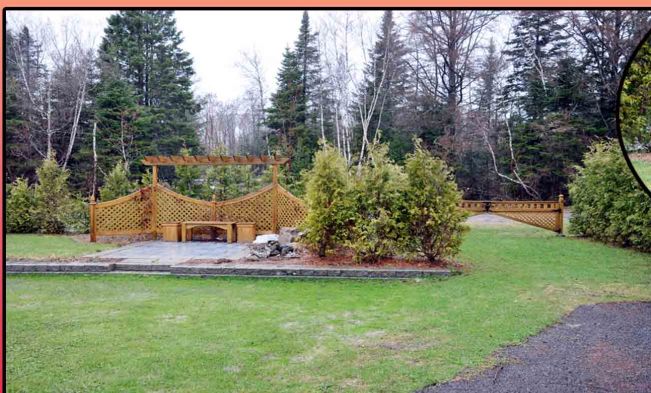
Réalisation : René Trudel